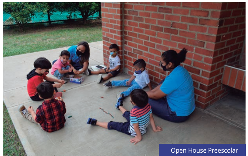
Open House Preescolar