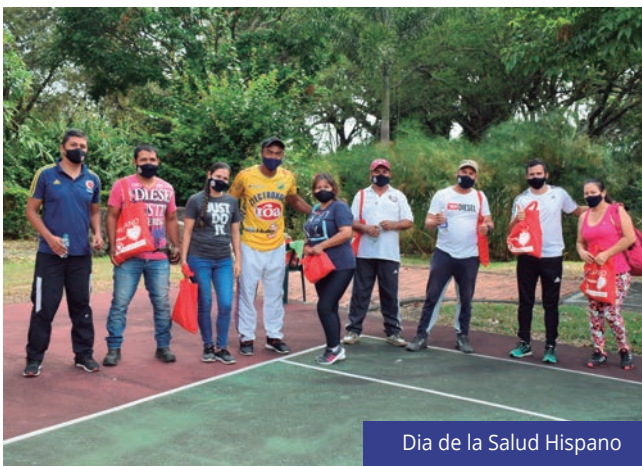
Día de la Salud Hispano