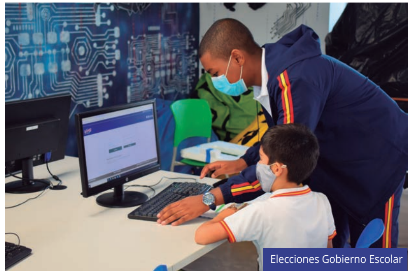
Elecciones Gobierno Escolar