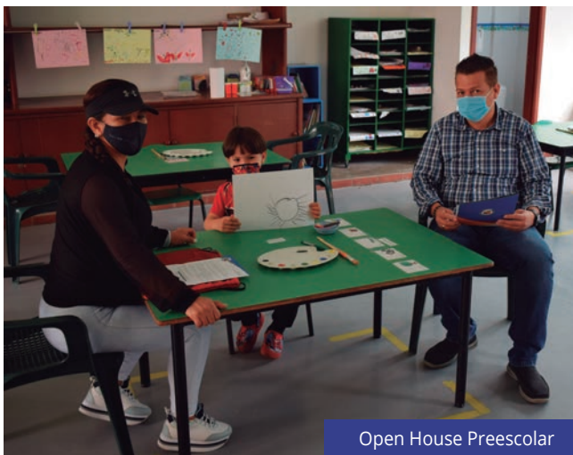
Open House Preescolar