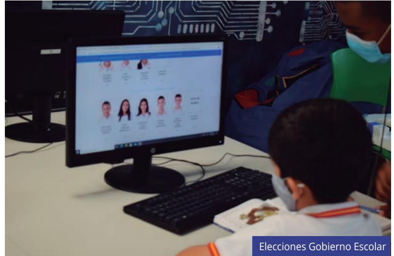
Elecciones Gobierno Escolar