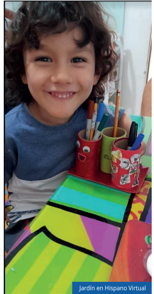
Jardín en Hispano Virtual