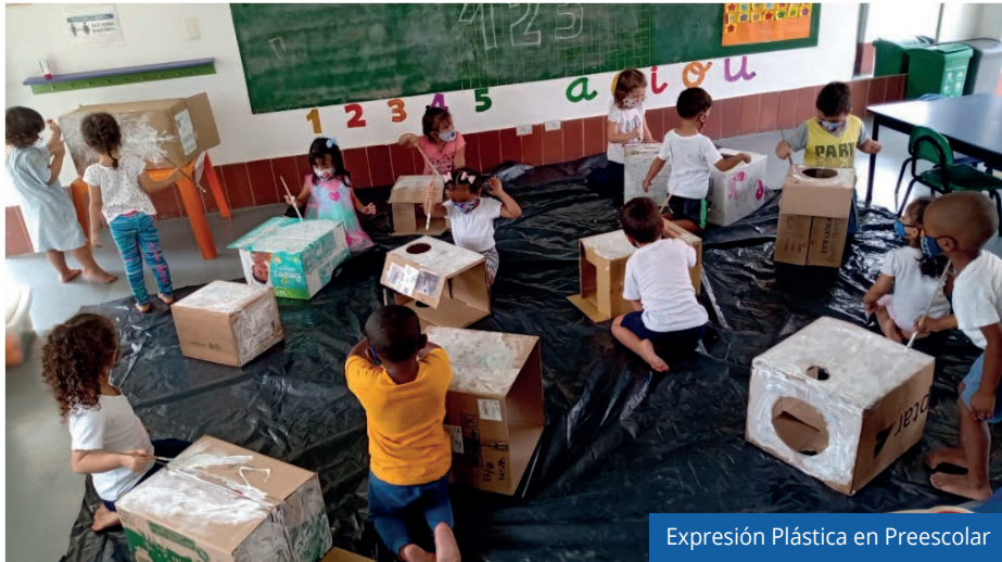
Expresión Plástica en Preescolar